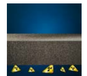
Bescherming tegen radon