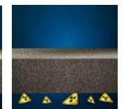
Bescherming tegen radon